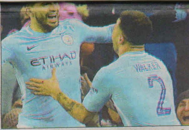
গোলের পর ওয়াকারের সঙ্গে উচ্ছ্বাস আশুয়েরোর।

ম্যাঞ্চেস্টার সিটি। মঙ্গলবার রাতে পেশা গুয়ারদিওলার দল সেমিফাইনালের প্রথম পর্বের খেলায় ২-১ ব্যবধানে হারিয়ে দিল ব্রিস্টল সিটিকে। বিরতির ঠিক আগে ববি রিডের পোনাল্টি থেকে করা গোলে এদিন ব্রিস্টলই প্রথম এগিয়ে যায়। বিরতির পর ৫৫ মিনিটে তাদের বেলজিয়ান তারকা কেভিন ডি'ব্রুইনের জোরালো শটে ১-১ হয়। সিটির হয়ে জয়সূচক গোলটি করেন আশুয়েরো। চলতি মরশুমে সব টুর্নামেন্ট মিলিয়ে নিজেদের ডেরায় টানা ১৬ টি ম্যাচ জিতে মঙ্গলবার ১৯২০-২১ মরশুমে তাদেরই গড়া অনন্য নজিরকে ছুঁয়ে ফেলল ম্যান সিটি।